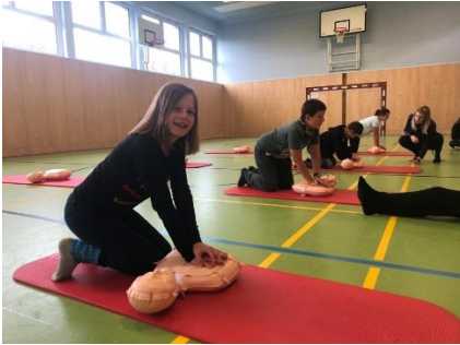
z.B.: Teilnahme am Wiederbelebungstag, Erste Hilfe – Kurs