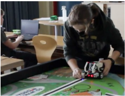
z.B.: Robotik – Lego „Mindstorms“