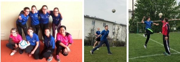
Faustball für Mädchen und Buben